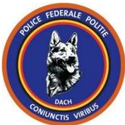
Figuur nr. 2: Spoorwegpolitie